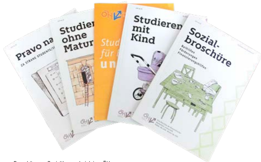
Broschüren zu Sozialthemen bei deiner ÖH

www.gesundheitskasse.at/cdscontent/?contentid=10007.868713&portal=oegkportal